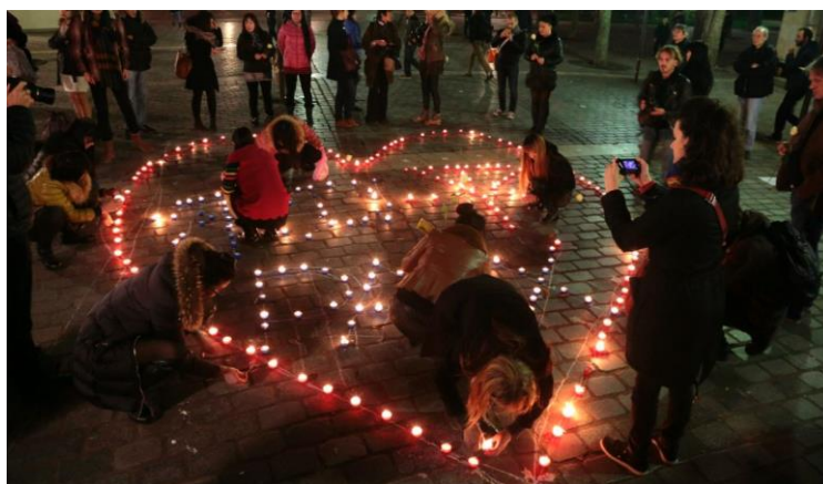
הפגנה בפריז למען

זכויותיהן של נשים בזנות, בשנה שעברה. הצוות של השרה שקד יבחן מודלים בינלאומיים להפלת לקוחות