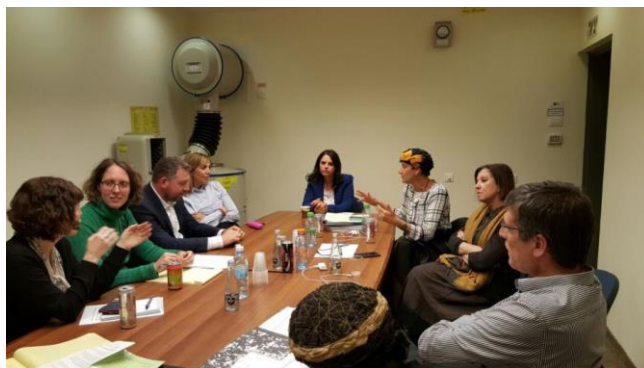
מועלם וגלאון בפגישה עם שקד

בחוק שאישרה האסיפה הלאומית בצרפת הוסדר לצד הענישה גם הסיוע לנשים בזנות. לפי המודל הצרפתי, לקוחות של שירותי זנות ייקנסו בעד 1,500 אירו על עבירה ראשונה ועד 3,750 אירו על עבירה חוזרת. לא ניתן יהיה להעמיד את הנשים לדין, ומי מהן שתבחר לצאת מעולם הזנות תהיה זכאית לשירותי רווחה נרחבים. נשים שאינן אזרחיות צרפת יוכלו לקבל מקלט זמני במדינה. בכך הצטרפה צרפת לשורת מדינות בעולם שבהן צריכת שירותי זנות היא עבירה, בהן שוודיה , נורווגיה, איסלנד ופינלנד.