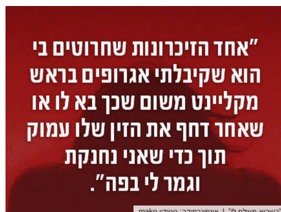
כשהוא משלם לי"