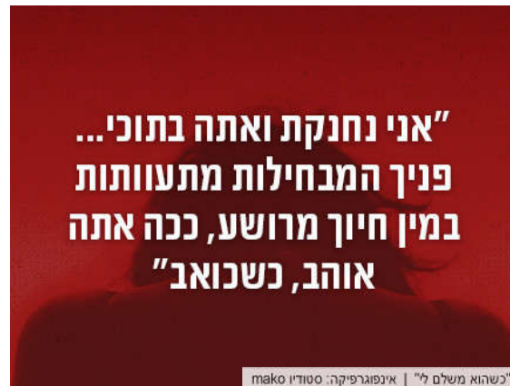
כשהוא משלם לי" | אינפורמטיקה: סטודיו mako

המדים והניידת, והיו מציעים לי לשכב איתם תמורת סמים ואקסטות, וכינו את זה 'פיניקים'. אז גם כשעברתי דברים איומים, ידעתי שאין לי במי לבטוח, למי יכולתי לפנות? ידעתי מראש שהם יגידו לי: את זונה, מה ציפית שיהיה? כאלו אין דבר כזה, לאנוס זונה".