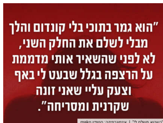
כשהוא משלם לי" | אינפורמטיקה: סטודיו mako

כשהקמפייין עלה, אחד החששות של טלי קורל, מנהלת מכון תודעה. היא שהיא ישחזר את הטראומה של הנשים. "הרי גם כשהן מספרות את הנרטיב הקשה שלהן, מאשימים את הקורבן - 'למה היא לא יצאה מזה?'. מנגד, נשים במעגל הזנות אומרות שהן רוצות להוציא את הדברים החוצה, זה מקל עליהן. בנות כותבות לתיבת ההודעות שלי ואני מפרסמת את זה באופן אנונימי. אישה שנמצאת כיום במעגל הזנות שולחת לי עדויות על לקוחות ספציפיים או רשמים מהזנות, זו מעין תרפיה עבורה וחשוב להן להעלות את המודעות כיצד הזנות נראית מבפנים".