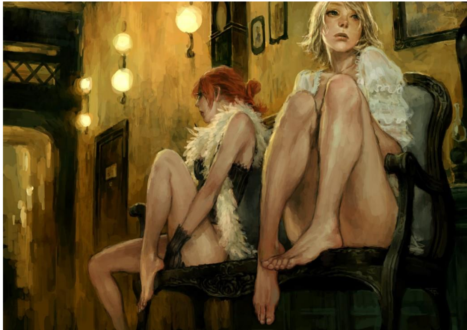
איור: fung chin pang