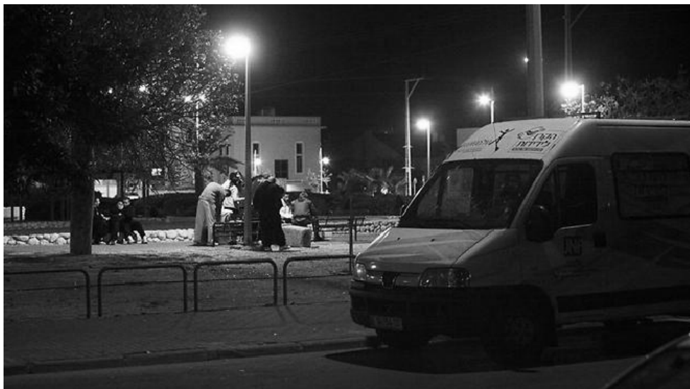
"הכי כיף כשבסיום אנו מקבלים חיבוק ענקי ומילת תודה".

ברגע שמתחילים קשה להפסיק, כשמגיעים לקבוצת נערים אנו מציגים את עצמנו, בתחילה ישנן המון חששות אך אחרי שיחה אותם נערים מבינים שאנו כאן בשבילם והכי כיף כשבסיום אנו מקבלים חיבוק ענקי ומילת תודה.