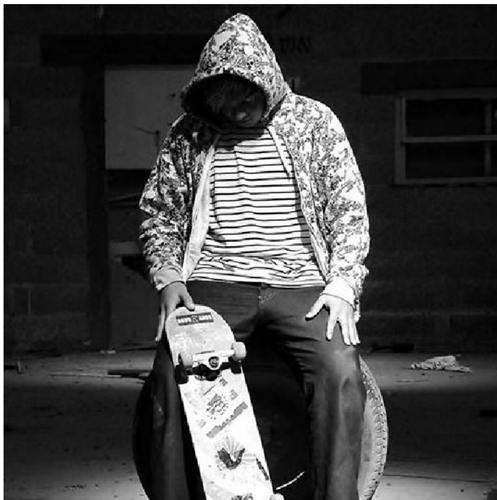
"הם רק רוצים שמישהו יהיה שם ביחד איתם, כדי שלא ירגישו לבד".

כך מצאתי את עצמי מגיעה ב-3 שנים האחרונות, מדי יום חמישי, באותה השעה, לאותו איזור מפגש בחולון. בין אם מדובר ביום חג או חול, יום חורף או קיץ, אני מגיעה ופוגשת שם צעירים ותיקים, לצד חדשים שעדיין חוששים, ומתחילה לשוחח איתם, לשתות איתם תה ופשוט להיות שם בשבילם.